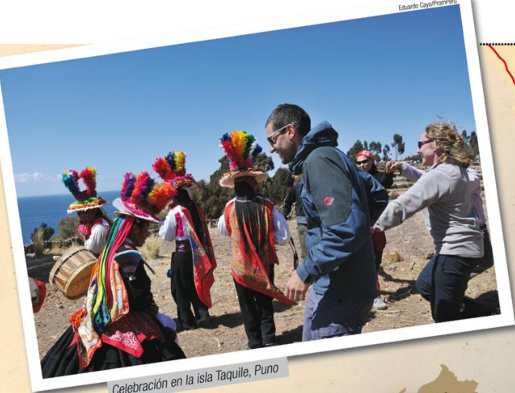
Celebración en la isla Taquile, Puno