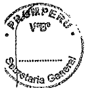
Blanca Magali Silva Velarde - Álvarez Ministra de Comercio Exterior y Turismo Presidenta del Consejo Directivo